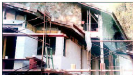
Arriba estructura de una casa en construcción, abajo plano de ubicación propuesta en Gaianes y edificio con el revestimiento exterior ya casi terminado.

Una inversión estimada de hasta 30 millones de euros y la creación de 150 empleos directos y 350 indirectos. Esa es la tarjeta de presentación del proyecto que está desarrollando un grupo empresarial con Arfil SA e Easy House Ingeco SL al frente, y empresas dedicadas a la construcción de casas industrializadas y modulares a través de un novedoso sistema basado en las estructuras de acero galvanizado, y que tiene intención de instalarse en el municipio de Gaianes.